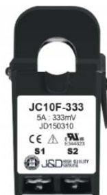
Obrázek 1 Proudový transformát 5A /330 mV

Výhodou tohoto přístupu je, že není potřeba přivádět proudový okruh až k přístroji, ale stačí, pokud je dostupný v rámci rozvodny. V daném místě je pak nasazen proudový transformátor XX A/ 330mV a odtud je již vedeno jen nízké napětí.